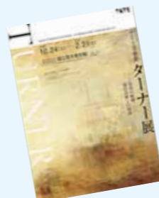
『ヴェネツィア、マドンナ・デッラ・サリユータのボーチから』 1835年頃 メトロポリタン美術館蔵